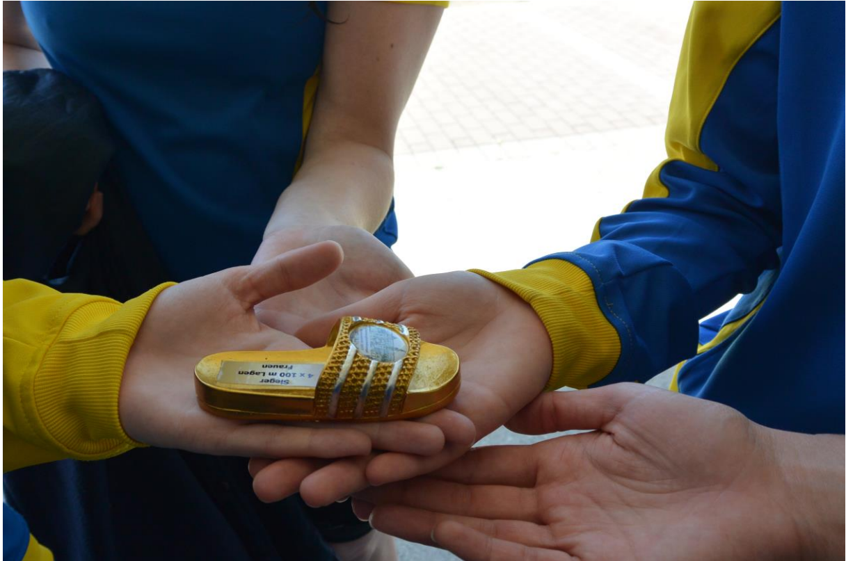
Der goldene „Badelatschen“ mit dem siegreichen Team